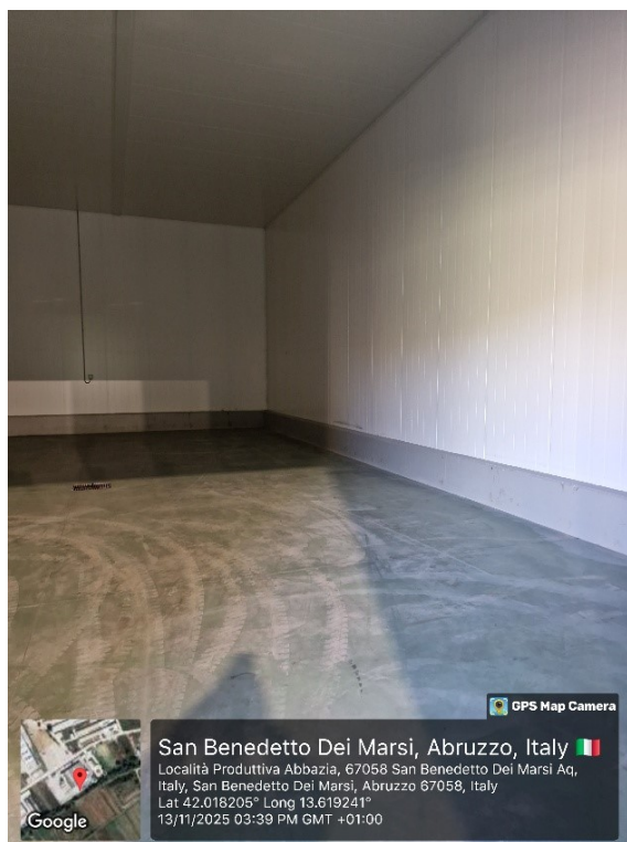
h) particolare impianto celle frigo